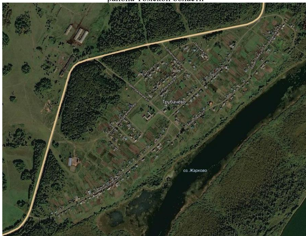
Рисунок 1. Расположение с. Трубачево