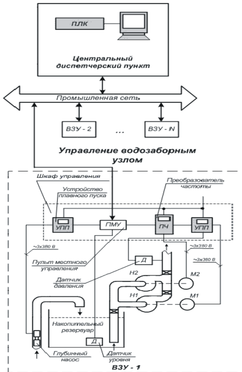
Рисунок 4 - Общая примерная функциональная схема автоматизации ВЗС

При реконструкции ВЗС необходимо предусмотреть автоматизированную систему управления объектами водоснабжения с возможностью, при соответствующем технико-экономическом обосновании, ее дальнейшего расширения и развития ее функциональности.